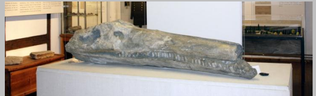
Teile der Ausstellung im Kanalmuseum