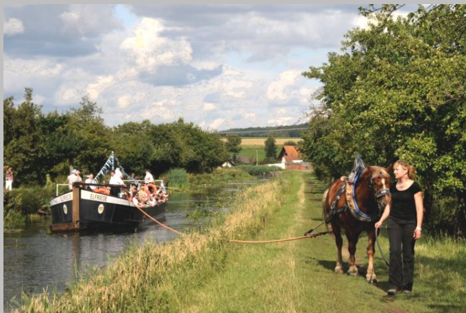
Treidelschiffahrt am Kanal bei Schwarzenbach